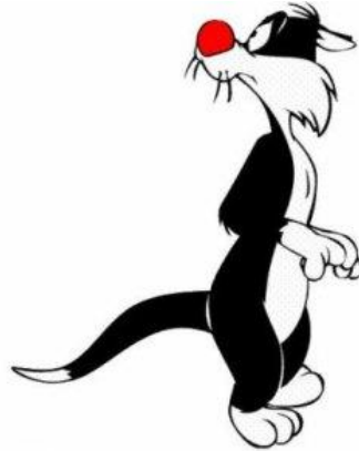
AEX-SG Log1 AM